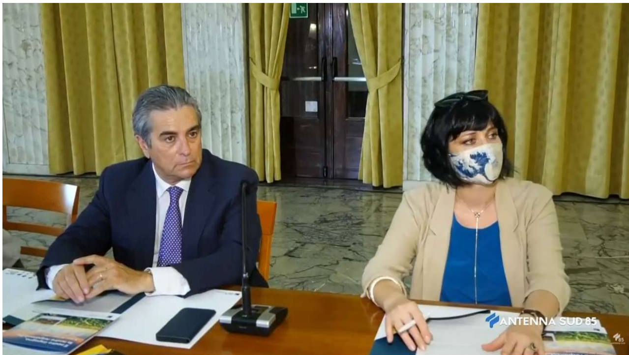
23 Giugno 2021 San Marzano di San Giuseppe TA BCC, sviluppo sostenibile

https://www.youtube.com/watch?v=yiycGD9I3Us