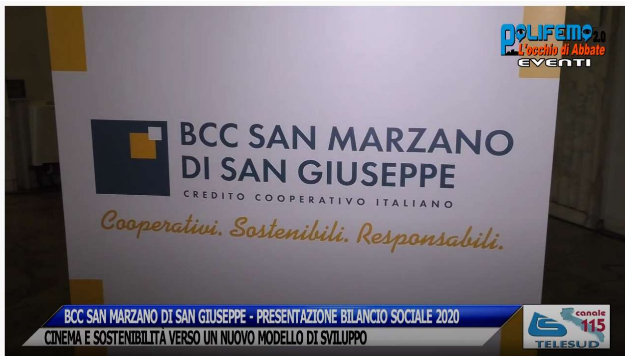
BCC SAN MARZANO DI S.G. - CINEMA E SOSTENIBILITÀ VERSO UN NUOVO MODELLO DI SVILUPPO

https://www.youtube.com/watch?v=QwdMT6Q7Q7Y