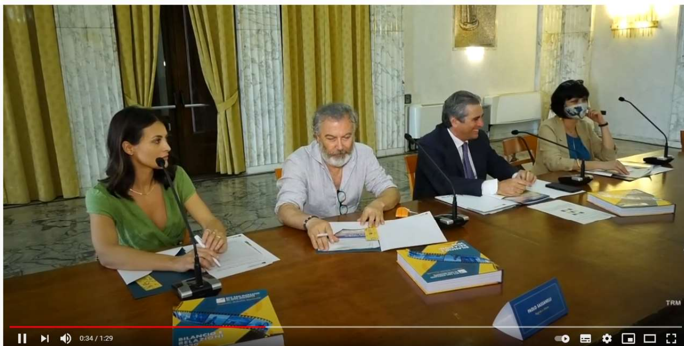
Cinema e sostenibilita' come modello di sviluppo: l'iniziativa e' della BCC san Marzano